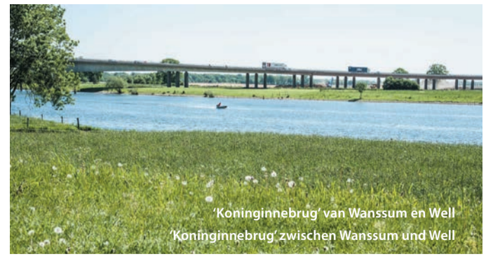
'Koninginnebrug' van Wanssum en Well 'Koninginnebrug' zwischen Wanssum und Well