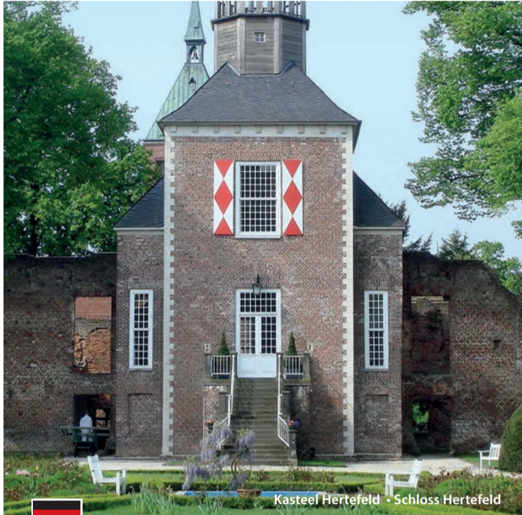
Kasteel Hertefeld • Schloss Hertefeld

Het Reindersmeer is geen natuurlijk meer; het werd eind vorige eeuw uitgegraven ten behoeve van de zand- en grindwinning. Daarna is het teruggegeven aan de natuur en maakt het deel uit van Nationaal Park De Maasduinen als één van de meest populaire plekken. Vanaf