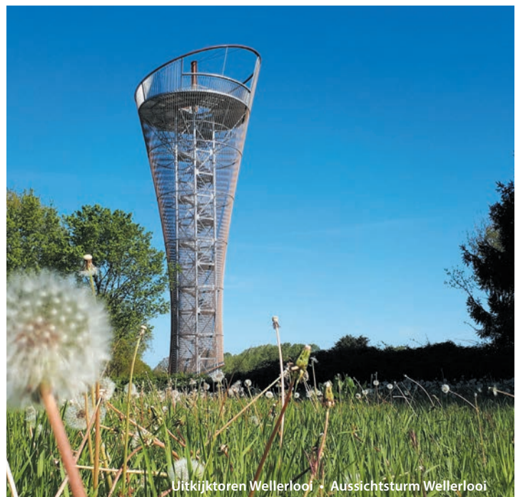
Uitkijktoren Wellerlooi • Aussichtsturm Wellerlooi

Auf dem Marktplatz von Uedem lädt seit Kurzem ein faszinierendes Miniatur-Tastmodell zum Entdecken und Erleben der Stadtgeschichte ein. Es zeigt Uedem so, wie es um das Jahr 1700 aussah – eine Zeit, in der die Stadt vom 14. Jahrhundert bis 1798 ihre Stadtrechte innehatte. Diese besonderen Rechte gingen zwar während der Französischen Zeit verloren, doch das Modell hält die Erinnerung an diese bewegte Vergangenheit lebendig.