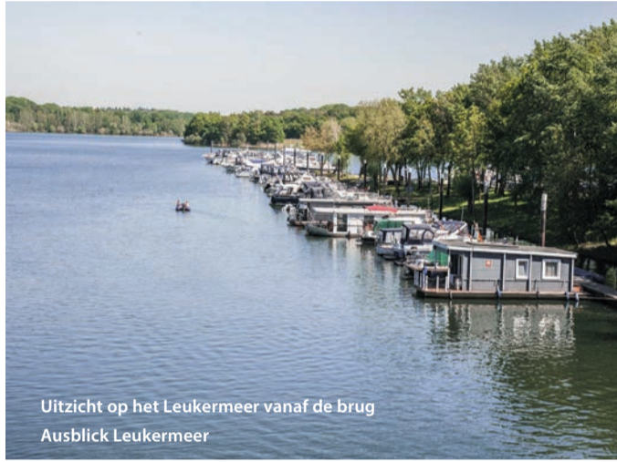
Uitzicht op het Leukermeer vanaf de brug Ausblick Leukermeer