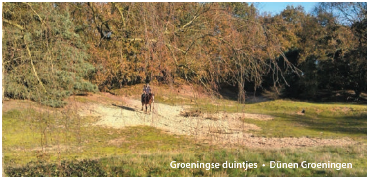
Groeningse duintjes • Dünen Groeningen