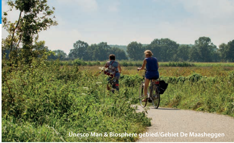
Unesco Man & Biosphere gebied/Gebiet De Maasheggen

Een natuurgebied waar u naast fotogenieke stuifduinen ook heide en geurige naaldbossen vindt.