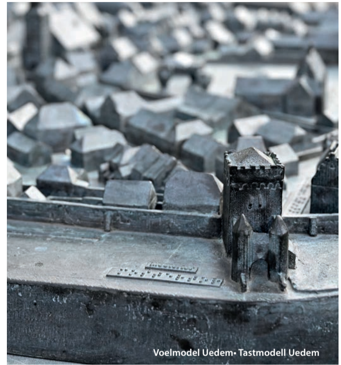
Voelmodel Uedem • Tastmodell Uedem

Das Reindersmeer ist kein natür- licher See. Er wurde am Ende des letzten Jahrhunderts für den Sand- und Kiesabbau ausgegraben. Später wurde er der Natur zurückgegeben und ist als Teil des Nationalparks