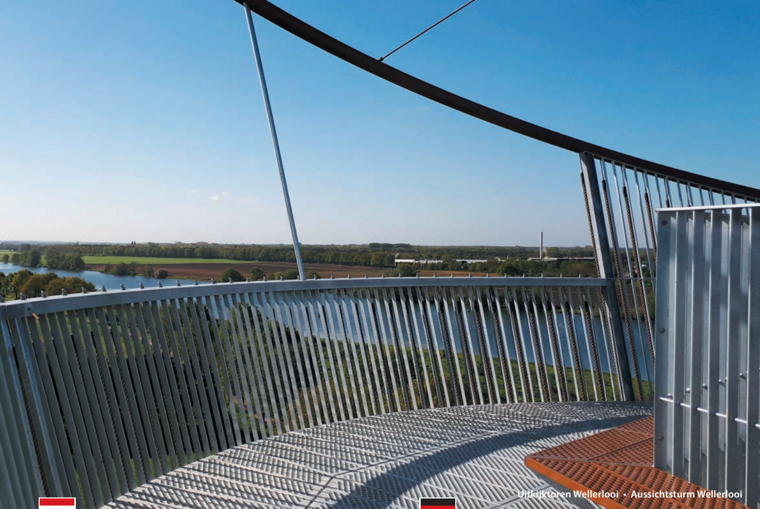
Uitzichtoren Wellerloo - Aussichtsturm Wellerloo