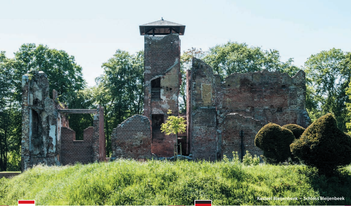
Kasteel Bleijenbeek · Schloss Bleijenbeek

Een heerlijkheid was het grondgebied van een Middeleeuwse heer die het recht had om orde te handhaven, recht te spreken en belasting te innen. Veel heerlijkheden waren in handen van de adel maar daarnaast ook van steden, om zo hun grondgebied te kunnen vergroten.