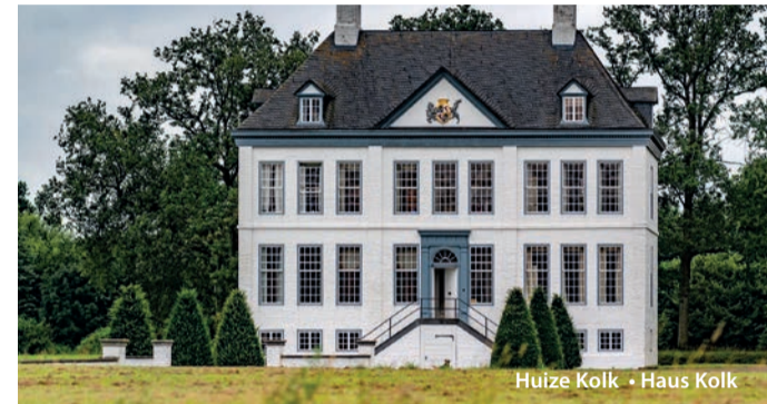
Huize Kolk • Haus Kolk

gehörten Well, Wellerloo, Ayen, Bergen (bis nach Heukelom) und an der anderen Seite der Maas ein Teil von Wanssum.