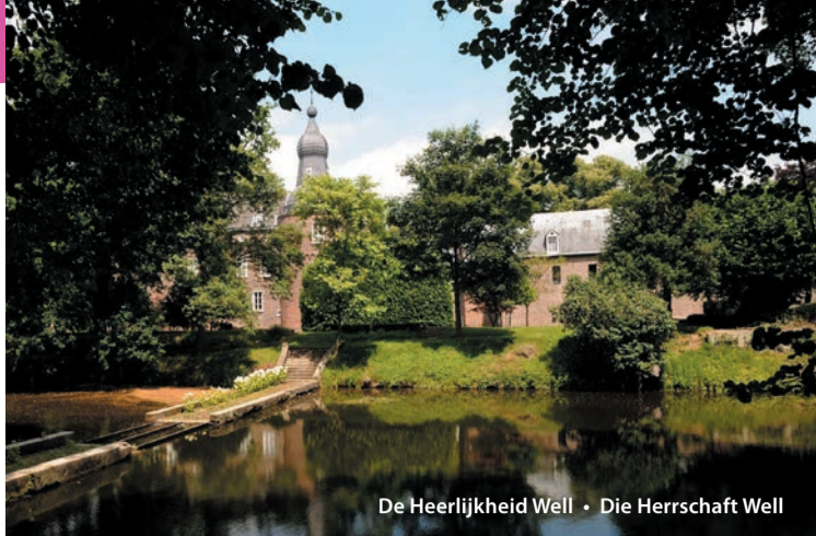
De Heerlijkheid Well • Die Herrschaft Well