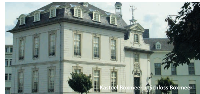
Kasteel Boxmeer • Schloss Boxmeer