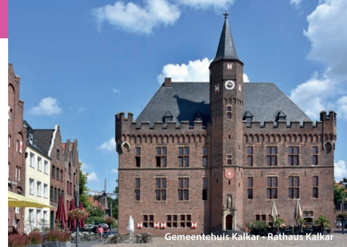
Gemeentehuis Kalkar • Rathaus Kalkar

Dank seiner strategischen Lage war Well jahrhundertlang eine zentrale Handelsstelle. In dem an der Maas gelegenen Donjon mit Wohnturm wohnte der Schlossherr. Die freie Herrschaft Well (mit großen eigenen Befugnissen) entstand im 11. Jahrhundert, als die zentrale Verwaltung des Gebietes Niedermaas und Rhein weggefallen war und der Schlosherr selbst die Verwaltung übernahm. Zu dieser Herrschaft