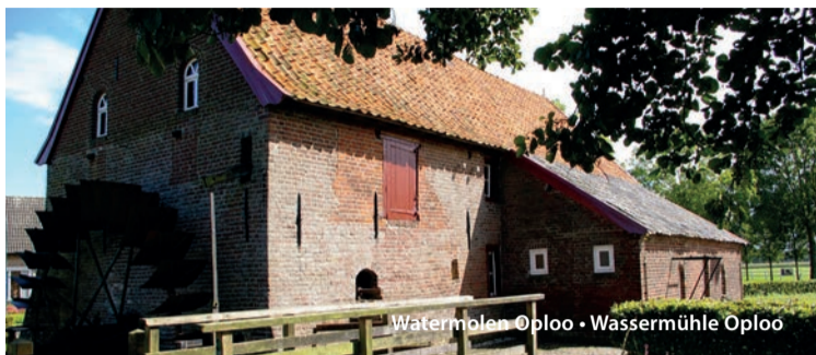
Watermolen Oploo • Wassermühle Oploo