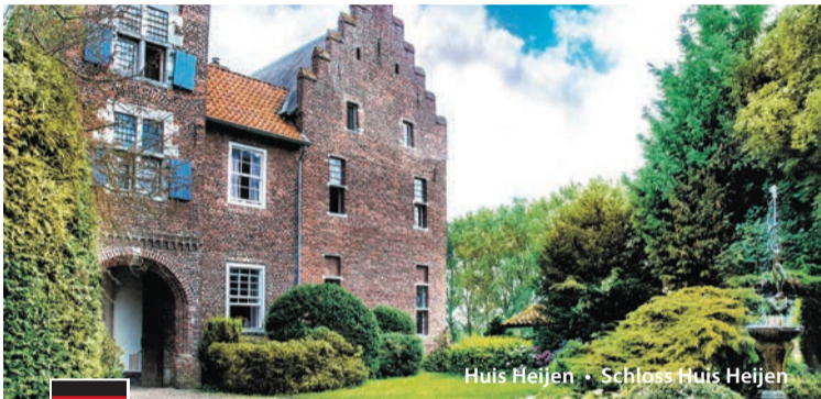
Huis Heijen • Schloss Huis Heijen