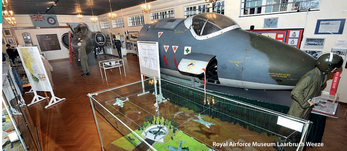
Royal Airforce Museum Laarbruch Weeze

Die Sammlung des Museums besteht hauptsächlich aus Gebrauchsgegenständen, Uniformen und damit zusammenhängenden Waren aus der Zeit des Zweiten Weltkrieges aus der Region rund um Groenningen. Jeder Gegenstand hat seine