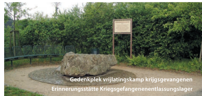
Gedenkplek vrijlatingskamp krijgsgevangenen Erinnerungsstätte Kriegsgefangenenentlassungslager