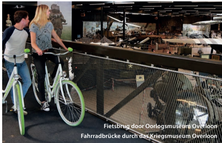
Fietsbrug door Oorlogsmuseum Overloon Fahrradbrücke durch das Kriegsmuseum Overloon

eigene Geschichte. Zwischen KNP 39 und 38. Nähe von Maasstraat.