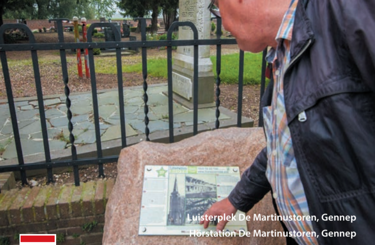
Luisterplek De Martinustoren, Gennepe Hörstation De Martinustoren, Gennepe