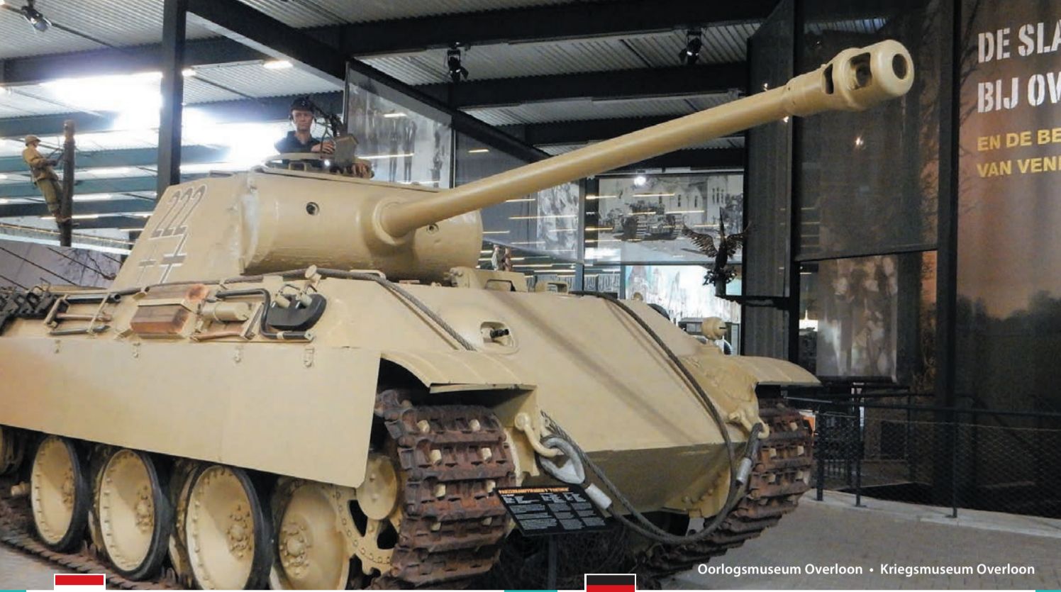
Oorlogsmuseum Overloon • Kriegsmuseum Overloon

De Remembranceroute voert langs het oorlogsverleden van het grensgebied Land van Guijk, Maasduinen en Niederrhein. Tijdens deze periode hebben de levenspaden van mensen uit Nederland en Duitsland elkaar gekruist en voor altijd ingrijpend veranderd. Over de grenzen heen verbindt deze route ons met elkaar, toen en nu.