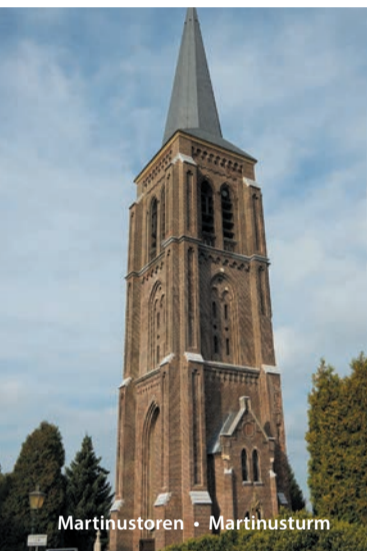
Martinustoren • Martinusturm

Onderweg zijn overal gezellige terrasjes waar je kunt genieten van verse streekgerechten. Of zoek jouw eigen picknickplek aan de Maas! Langs de route kom je mooie kapelletjes, kunstwerken en ander bezienswaardigheden tegen. En: vergeet niet verse streekproducten voor thuis te kopen in een van de leuke streekwinkeltjes langs de route.