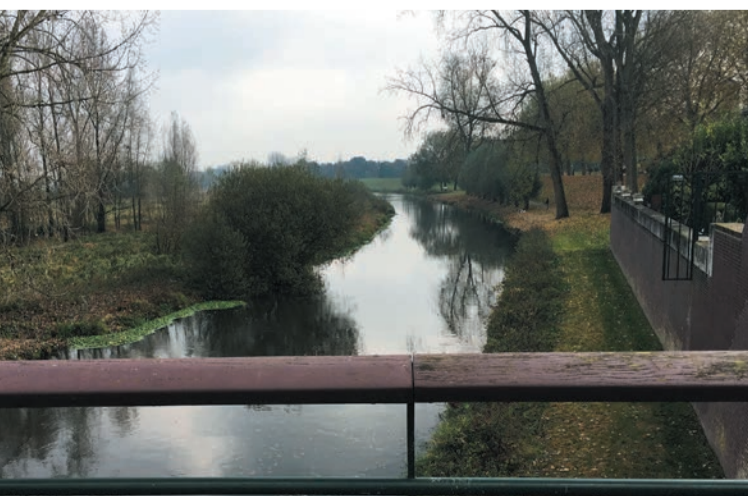
Uitzicht over de Niers vanaf de Highlanderbridge Gennepe Ausblick 'Highlanderbridge' Gennepe

Pal aan het Vrijheidsplein ligt de Highlander Bridge, ook wel de Niersbrug genoemd. Deze brug speelde een belangrijke rol bij de bevrijding. Door de hoge waterstand en het uiteindelijk opblazen van de brug duurde het lang voordat Gennepe heroverd kon worden door de Britten. Uiteindelijk bedachten zij de mobiele brug die in enkele uren opgebouwd kon worden. Hierdoor kon Gennepe uiteindelijk bereikt worden.