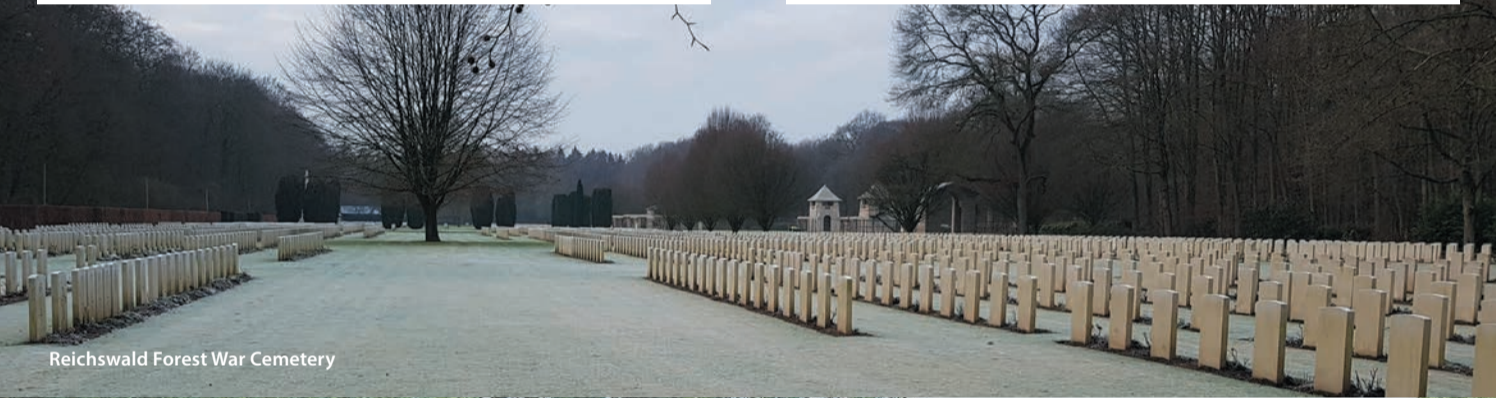
Reichswald Forest War Cemetery

Die Remembranceroute führt entlang der Kriegsvorgangeneit des Grenzgebiets Land van Guijk, Maasduinen und Niederrhein. In dieser Periode haben sich die Lebenswege von Menschen aus Deutschland und den Niederlanden gekreuzt und für immer tiefgreifend verändert. Damals wie heute sind wir durch diese Route grenzüberschreitend miteinander verbunden.